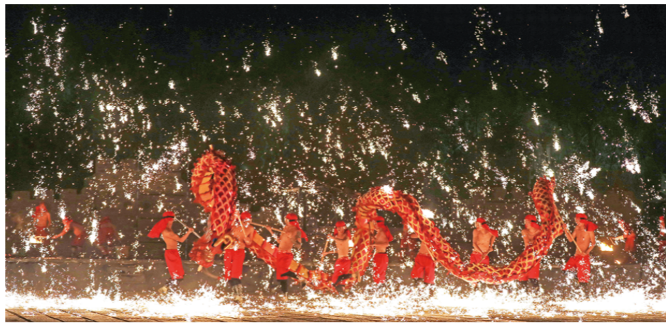
《火龙舞盛世》