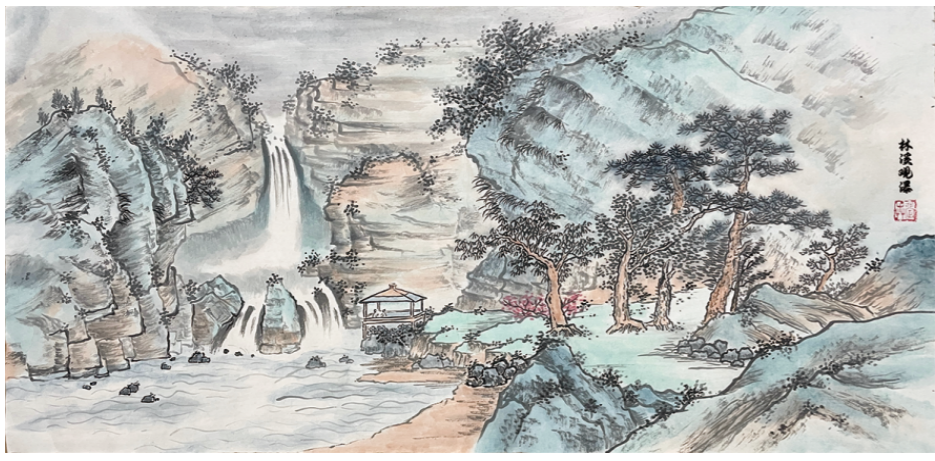
《林溪观瀑》/绘画 □田陈煤矿 张玉升