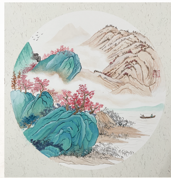
《溪山红树》/绘画 □田陈煤矿 张玉升